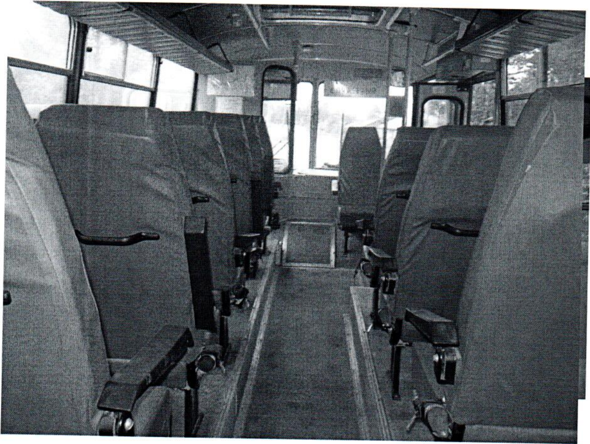
Образец вида ТС